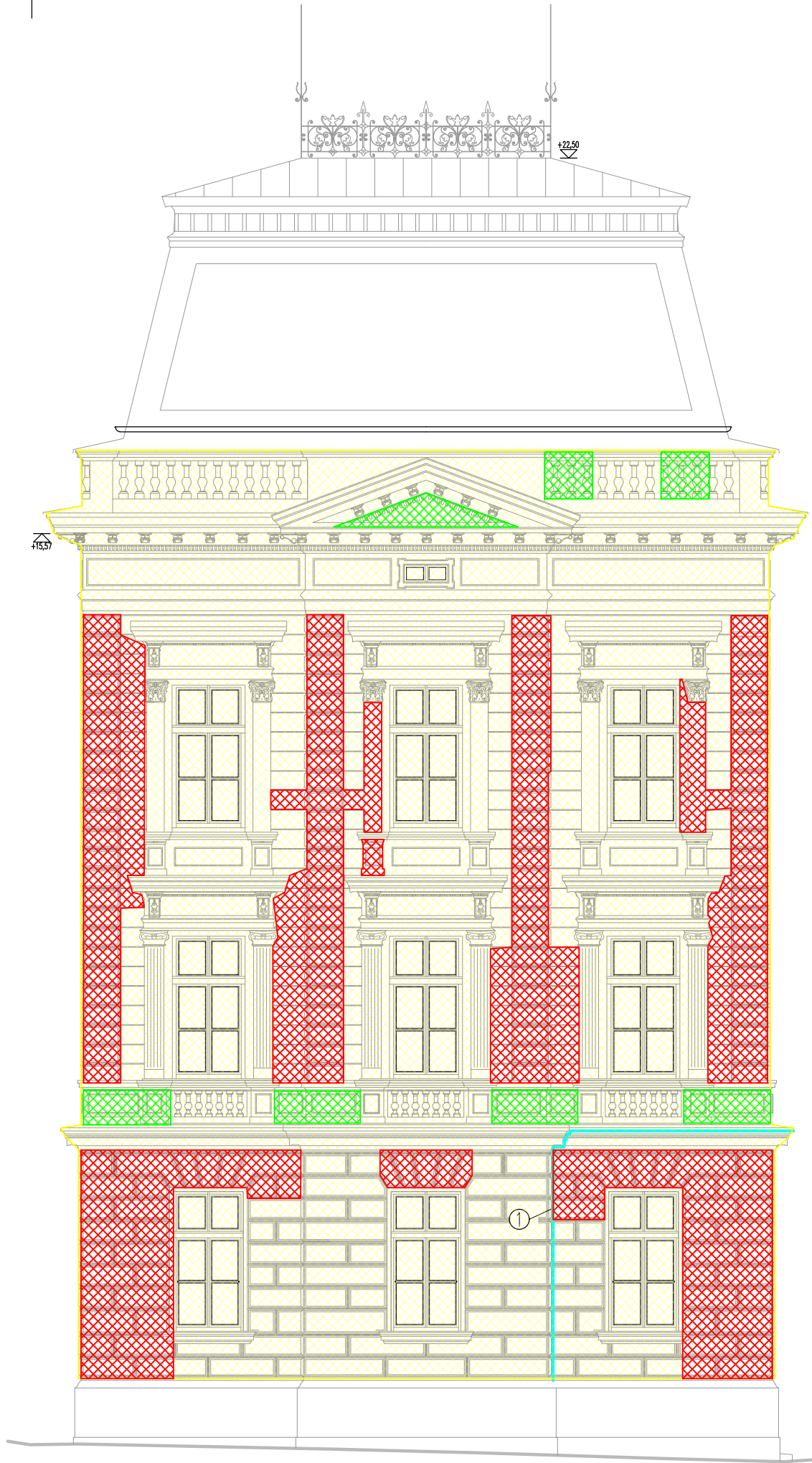
průčelí 2 - celková plocha fasády 218,90 m 2 - celková plocha soklu 17,60 m 2